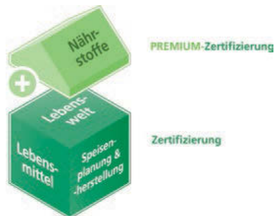
Abbildung 2: Qualitätsbereiche der Zertifizierung

Nach erfolgreich bestandenem Audit erhält der Caterer ein Zertifikat einschließlich DGE-Logo beziehungsweise DGE-PREMIUM-Logo und kann damit werben. Die Audits gelten als bestanden, wenn mindestens 60 Prozent in jedem Qualitätsbereich der Kriterien erfüllt sind.